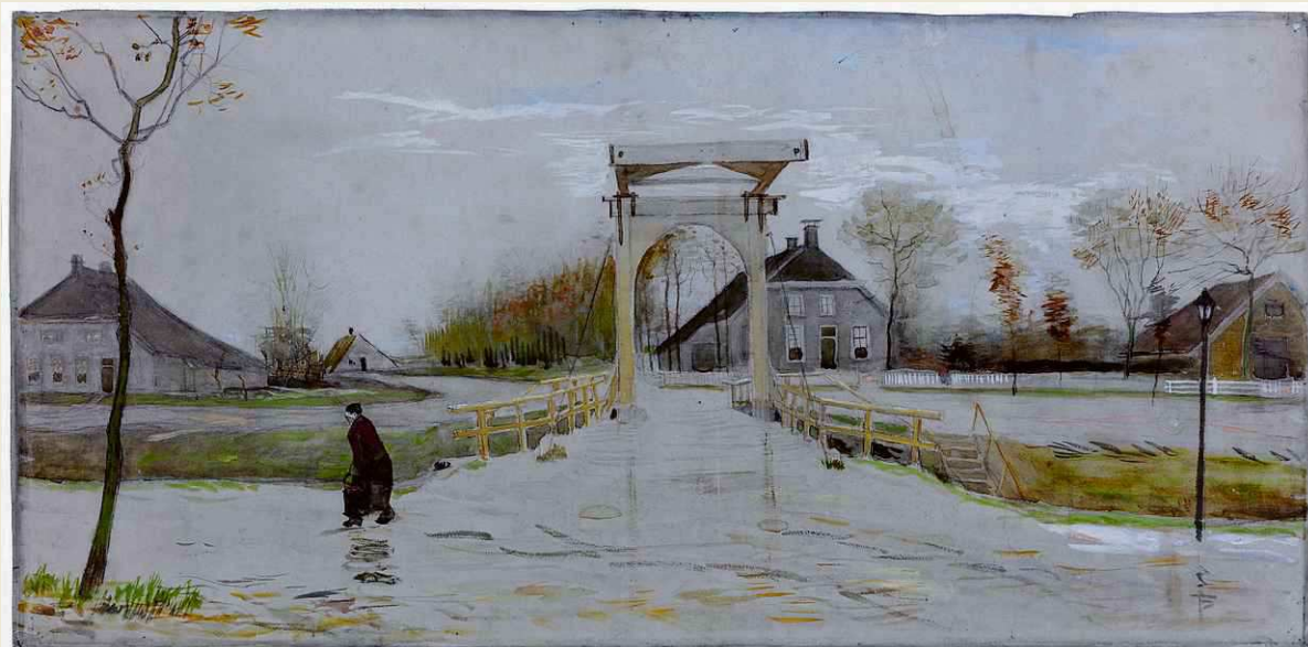
Ophaalbrug Nieuw-Amsterdam.

Schetste Vincent van Gogh het kerkhof van Pesse of van Hollandscheveld? Het Drents Museum, Drents Archief en Het Drents Landschap bogen zich over deze vraag en concluderen: het is Pesse.